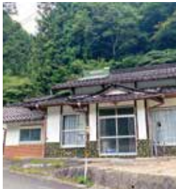
西城町熊野 築年：不明 床延面積：99.29㎡ 土地面積：198.80㎡