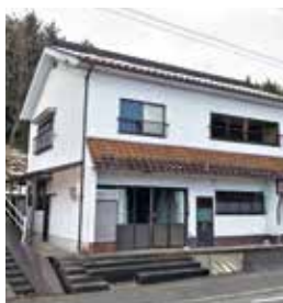
新庄町 築年：昭和62年新築 床延面積：207.12㎡ 土地面積：237.98㎡