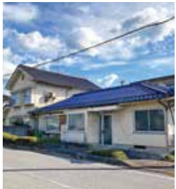
七塚町 築年：昭和39年新築／ 昭和50年増築 床延面積：290.38㎡ 土地面積：645.89㎡