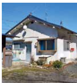
東本町 築年：不明 床延面積：76.69㎡ 土地面積：330.79㎡