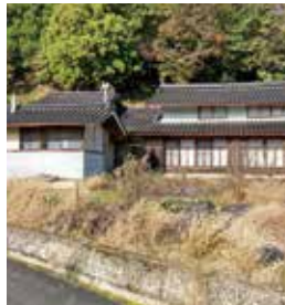
西城町栗 築年：不明 床延面積：140.49㎡ 土地面積：322.36㎡