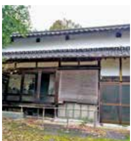
本町 築年：不明 床延面積：271.04㎡ 土地面積：875.55㎡