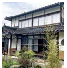
大久保町 築年：昭和54年新築 床延面積：204.15㎡ 土地面積：687.66㎡