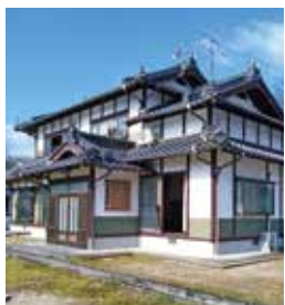
三日市町 築年：平成元年 床延面積：225.96㎡ 土地面積：1,038.47㎡