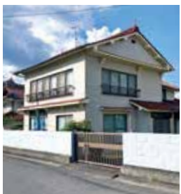
三日市町 築年：昭和40年新築 床延面積：136.45㎡ 土地面積：754.63㎡