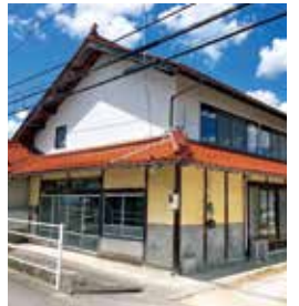
山内町 築年：不明 床延面積：166.10㎡ 土地面積：647.80㎡