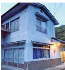
西城町福山 築年：不明 床延面積：82.64㎡ 土地面積：147.08㎡