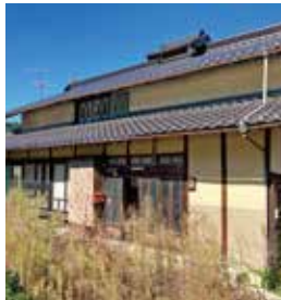
西城町栗 築年：不明 床延面積：115.70㎡ 土地面積：137.18㎡