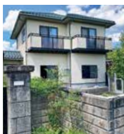
七塚町 築年：不明 床延面積：335.71㎡ 土地面積：819.56㎡