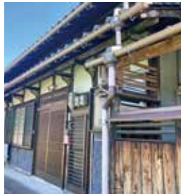
中本町 築年：不明 床延面積：101.22㎡ 土地面積：161.40㎡