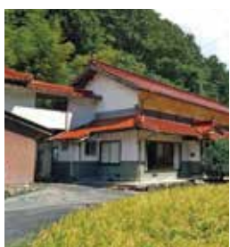
比和町木屋原 築年：不明 床延面積：149.32㎡ 土地面積：773.55㎡