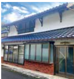
西城町西城 築年：不明 床延面積：109.07㎡ 土地面積：132.23㎡