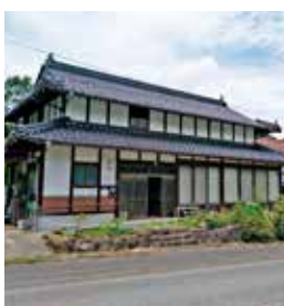
高野町和南原 築年：不明 床延面積：123.65㎡ 土地面積：449.00㎡